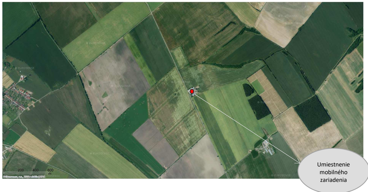
Obr. 1 Umiestnenie navrhovanej činnosti – širšie vzťahy